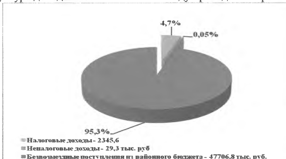
Рис . 1

В структуре доходов поселения наибольший удельный вес составили безвозмездные поступления – 95,3% (47 706,8 тыс. рублей), налоговые доходы поступили в сумме 2345,6 (4,7%), неналоговые доходы – 29,3 тыс. рублей (0,05%). Структура доходов поселения в 2016 году приведена на рис. 1